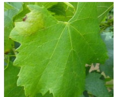
Tache de mildiou

On ne note pratiquement pas d'évolution par rapport à la situation décrite la semaine dernière : la quasi-totalité des parcelles du vignoble apparaît très saine. Dans de très rares situations, une sortie de taches sur jeunes feuilles a pu être notée suite aux pluies des 07 au 10 juillet.