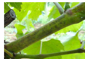
Oïdium sur rameau

En situations tardives, un comptage bilan sur grappes a été récemment ou va être prochainement réalisé pour évaluer le risque de fin de campagne.