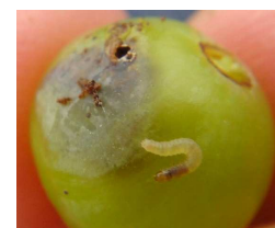
Eudémis sortant de sa perforation

Sur cette campagne 2011, le potentiel vers de grappe 2 ème génération aura été finalement faible dans le vignoble jurassien.