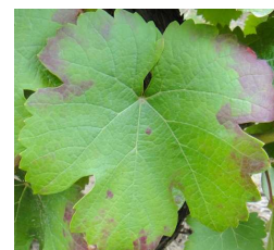
Symptômes de grillure causés par les cicadelles vertes

On demeure encore loin du seuil d'intervention fixé à 100 larves pour 100 feuilles (seuil de nuisibilité plus élevé).