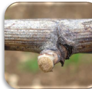
Bourgeon dans le coton

Dans les situations les plus tardives, le gonflement des bourgeons débute et dans les Chardonnays les plus précoces, le stade pointe verte est atteint avec un débourrement qui n'est pas loin.