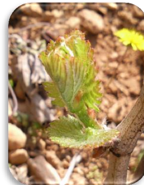
1 feuille étalée

2017 se classe pour l'instant dans la veine des années les plus précoces comme 2007 ou 2011.