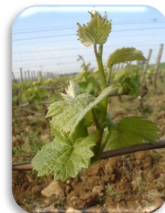
5 feuilles étalées

Gel : les 1 er et 2 mai, les températures sont descendues jusqu'à -1/-1,5°C dans certains secteurs bas des vignobles de l'Yonne et du Châtillonnais notamment. Il est encore trop tôt pour avoir une vision globale sur les dégâts éventuels. Un point sera fait dans le prochain bulletin.