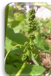
9-10 feuilles étalées boutons floraux agglomérés

Grêle : un petit épisode localisé (Gamay en Côte d'Or et St Bris, Chemilly, Viviers dans l'Yonne) a eu lieu mardi 08 mai ; les dégâts se limitent la plupart du temps à quelques perforations de feuilles et de façon très ponctuelle à quelques rameaux sectionnés.