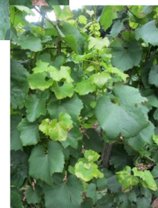
Taches fraîches sur feuillettes