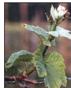
5-6 feuilles étalées

2013 fait partie des années les plus tardives et aucune amélioration météo ne semble au programme dans les prochains jours.