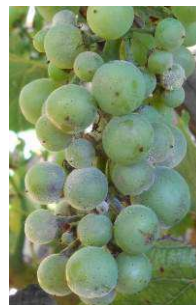
Oïdium sur baies

Une évolution s'observe toutefois sur certaines parcelles qui présentaient déjà une attaque régulière d'oïdium la semaine dernière mais également sur certains secteurs tardifs jusque-là peu concernés.