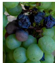
Les symptômes de black-rot sont très rares

Cette maladie est restée très discrète tout au long de la campagne aussi bien sur feuilles que sur grappes. La sensibilité des grappes vis-à-vis du black-rot devient nulle à partir de véraison.