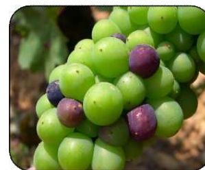
1ères baies vérees

A l'exception du Beaujolais Saône et Loire où les premières baies vérees s'observent assez régulièrement, elles restent encore rares dans les autres vignobles. En secteurs tardifs, la vigne est toujours au stade fermeture.