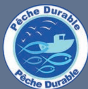
LES PRODUITS ISSUS DE LA PÊCHE MARITIME BÉNÉFICIAINT DE L'ÉCOLABEL PÊCHE DURABLE

Les produits issus d'une exploitation bénéficiant de la certification environnementale de niveau 2 entrent également dans le décompte uniquement jusqu'au 31 décembre 2029.