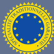
LES PRODUITS BÉNÉFICIAINT D'UNE SPÉCIALITÉ TRADITIONNELLE GARANTIE (STG)

54 produits bénéficient de la mention STG en Europe, tels que la mozzarella en Italie, le jambon Serrano en Espagne ou la moule de Bouchot en France.