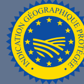
LES PRODUITS BÉNÉFICIAINT D'UNE INDICATION GÉOGRAPHIQUE (IGP)