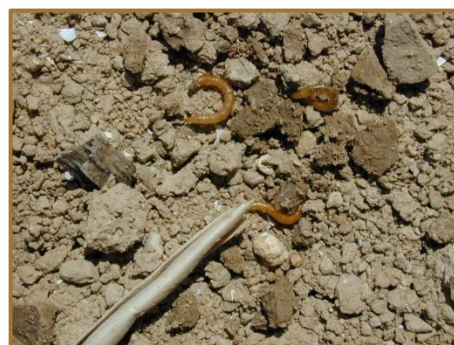
Larves de taupins