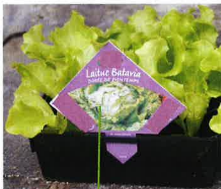
PP imprimé au dos

Exemples non exhaustifs d'apposition de Passeport Phytosanitaire :