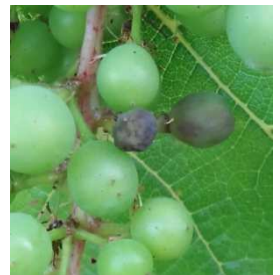
Premiers symptômes de Rot-brun

Vignoble jurassien : une sortie de mildiou sur feuilles a été constatée dans tout le vignoble, notamment de Gevingey à Voiteur, en passant par L'Etoile. Plus au Nord, certains secteurs d'Arbois à l'ouest de la N83. Cela va de quelques taches isolées à plus de 50 taches par cep ; des symptômes sur grappes ont été observés dans quelques situations.