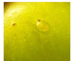
Oeuf avec des ponctuations rouge : ponte de Cochylys

Dans 68% des cas, aucun œuf n'a été découvert à l'issue des comptages réalisés sur un minimum de 50 à 100 grappes.