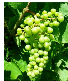
Stade "fermeture de la grappe"

Le stade fermeture de grappe est maintenant atteint dans une majorité de situations. Les parcelles les plus précoces ont dépassé ce stade de 8 à 10 jours, les plus tardives sont encore à baies à taille de pois. Pour évaluer la précocité de l'année, on doit maintenant attendre le stade début véraison qui constituera le prochain point repère.