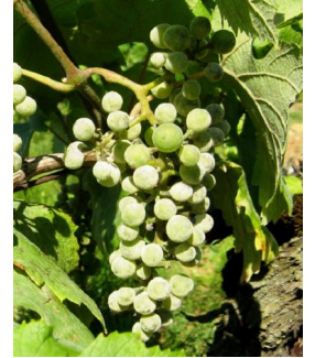
Oïdium sur grappe dans un TNT

Concernant la gestion de l'oïdium en fin de campagne, la règle de décision reste la même que les années précédentes : un bilan sanitaire devra être réalisé dans chaque parcelle 10 à 21 jours après le stade fermeture de grappe pour juger du niveau d'attaque de l'oïdium sur grappes et définir la conduite à tenir :