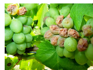
Symptôme d'échaudage sur Poulсарd

Par ailleurs, les fortes températures des 25-26 juin ont été à l'origine de symptômes d'échaudage. Ceux-ci sont observés à des degrés divers dans de très nombreuses parcelles du vignoble et se concentrent presque exclusivement sur les faces exposées au soleil couchant. Ils ne doivent pas être confondus avec des symptômes de black-rot ou de mildiou (rot-brun).