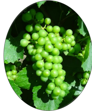
Stade début fermeture de la grappe

Le stade le plus régulièrement rencontré est " début fermeture de la grappe ". En parcelles tardives, les baies vont de taille de plomb à taille de pois.