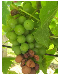
Echaudage sur Poulsard

Accident climatique : les fortes chaleurs de la semaine dernière (32-34°C) ont provoqué de l'échaudage sur grappes dans certaines parcelles, notamment sur Poulsard. L'intensité des symptômes dépend de l'exposition et de la densité du feuillage. Ceux-ci se concentrent sur la face exposée soleil couchant et ne doivent pas être confondus avec du rot-brun.