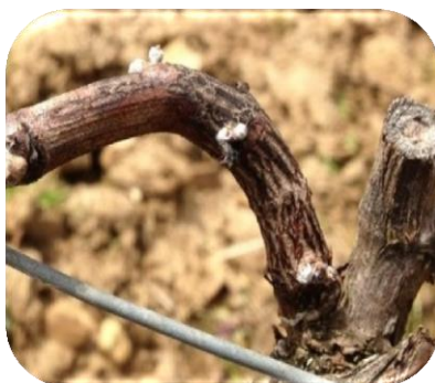
Symptômes d'excoriose (CA21) Nécroses brunes-noirâtres à la base des rameaux

Les observations excoriose effectuées dans la Nièvre confirment le bilan dressé la semaine dernière dans les autres vignobles, à savoir une très faible présence de la maladie.