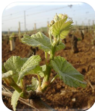
3-4 feuilles étalées

Les conditions particulièrement chaudes et ensoleillées de la semaine écoulée ont été très propices au développement de la végétation. Avec l'apparition de 3 nouvelles feuilles, les parcelles les plus précoces, atteignent le stade 6 à 7 feuilles étalées.