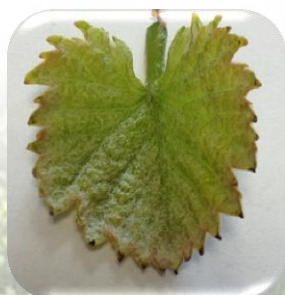
Bords du limbe noircis

Les comptages araignées rouges et typhlodromes ont dû être effectués. Dans les parcelles les plus tardives, terminer les observations.