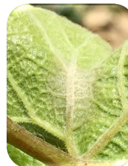
Tache d'oïdium bien sporulée