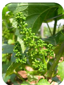
Boutons floraux séparés dans les parcelles les plus précoces

Les conditions de la semaine écoulée ont encore été très favorables au développement de la végétation.