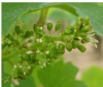
Toutes 1 ères fleurs

Les conditions fraîches des 7 derniers jours ont été moins favorables au développement de la végétation. On dénombre en moyenne 1 nouvelle feuille et les stades vont de 8-9 feuilles étalées dans les secteurs les plus tardifs à toutes 1 ères fleurs en parcelles précoces. Le 20 mai, quelques averses de grêle ont touché localement les vignobles de Côte d'Or, Saône et Loire, Yonne et Nièvre. Les dégâts se limitent le plus souvent à des impacts sur feuilles et parfois sur inflorescences.