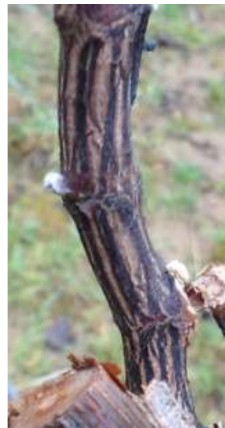
Nécroses en fuseau : un des symptômes de l'excoriose

Dans les parcelles où des symptômes significatifs d'excoriose ont été identifiés lors des travaux de taille ou de liage des baguettes, un comptage bilan doit être réalisé dès maintenant.