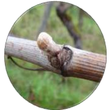
Stade "Bourgeon dans le coton"

A ce jour, 2016 se positionne comme une année moyenne, proche de 2015.