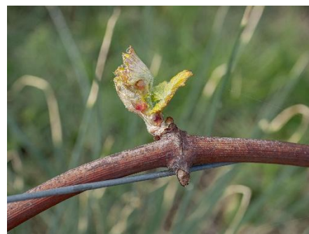
Figure 1 : 1 feuille étalée