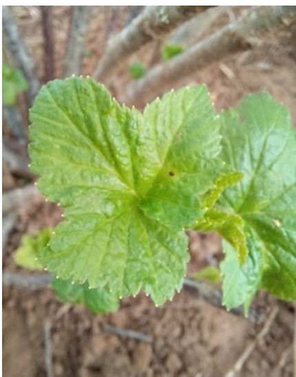
▲ Symptômes d'anthracose tache brune en tête d'épingle)

Ces conditions défavorables à son développement devraient se maintenir dans les 8 prochains jours malgré la remontée des températures.