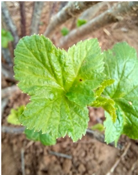
▲ Symptômes d'anthracose tache brune en tête d'épingle)

Les prochaines pluies alliées aux températures plus chaudes sont cependant à surveiller (samedi pluvieux et averses annoncées jusqu'à mardi avec des maximales comprises entre 13° C et 17° C sur le secteur de Beaune) : ces conditions sont plus favorables au développement de l'anthracose.