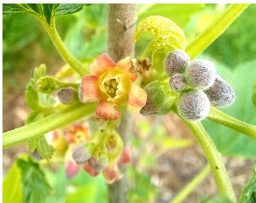
► 1 ère fleur ouverte sur Noir de Bourgogne, secteur forêt de Cîteaux

Les journées plus chaudes annoncées dans les prochains jours vont permettre au cassis de continuer à se développer (maximales comprises entre 13° C et 17° C à Beaune). Un nouvel épisode pluvieux est prévu à partir de samedi avec des averses qui pourraient se maintenir jusqu'à mardi.