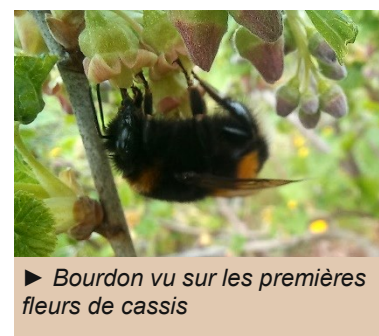
► Bourdon vu sur les premières fleurs de cassis

Intéressé ? N'hésitez pas à parcourir la Note Nationale Biodiversité sur les abeilles sauvages ou l' article sur les pollinisateurs sauvages de l'OFB. (voir dernière page)