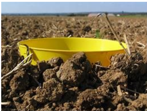
L. Jung, Terres Inovia

Pour capturer l'altise d'hiver ou grosse altise, la cuvette doit être enterrée, bord supérieur à 1-2 cm au dessus du sol.