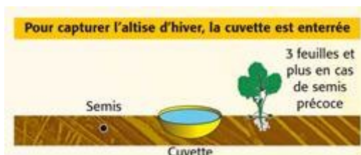
Cuvette enterrée (illustration Terres Inovia)

Elles se placent au niveau de la végétation sauf pour les grosses altises (altises d'hiver) où la cuvette doit être enterrée.