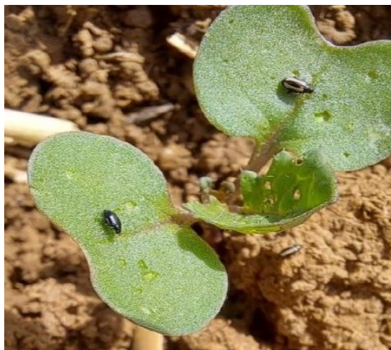
Présence des 2 espèces de petites altises : noire et rayée, E. Courbet (CA70)

Dans les zones où des repousses de colza sont présentes, la destruction de celles-ci entraîne un déplacement de population, et donc augmente le risque.