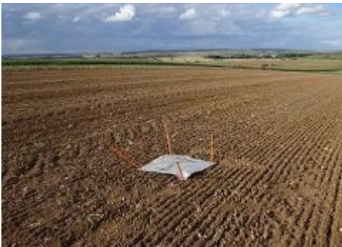
Pièges à limaces (Terres Inovia)

Avant la levée de la culture, l'observation des limaces grises et noires se fait à l'aide de 4 pièges de 25x25 cm préalablement humidifiés par trempage, éloignés d'au moins 5m les uns des autres.