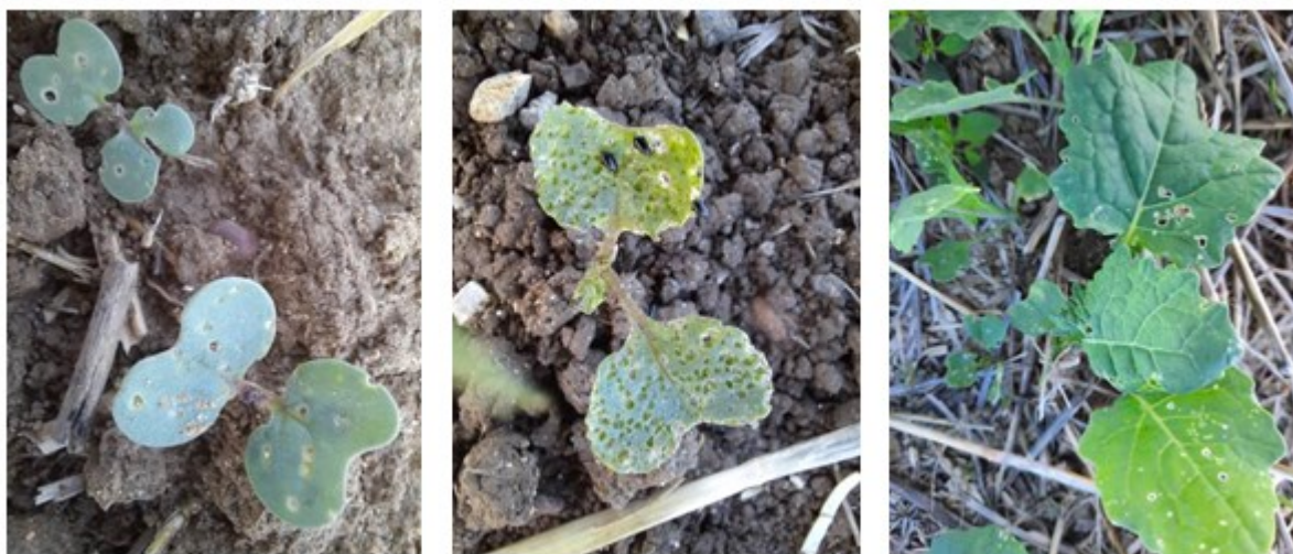
Dégâts de petites altises plus ou moins intense sur des colzas plus ou moins développés, P. Chopard (CA39)