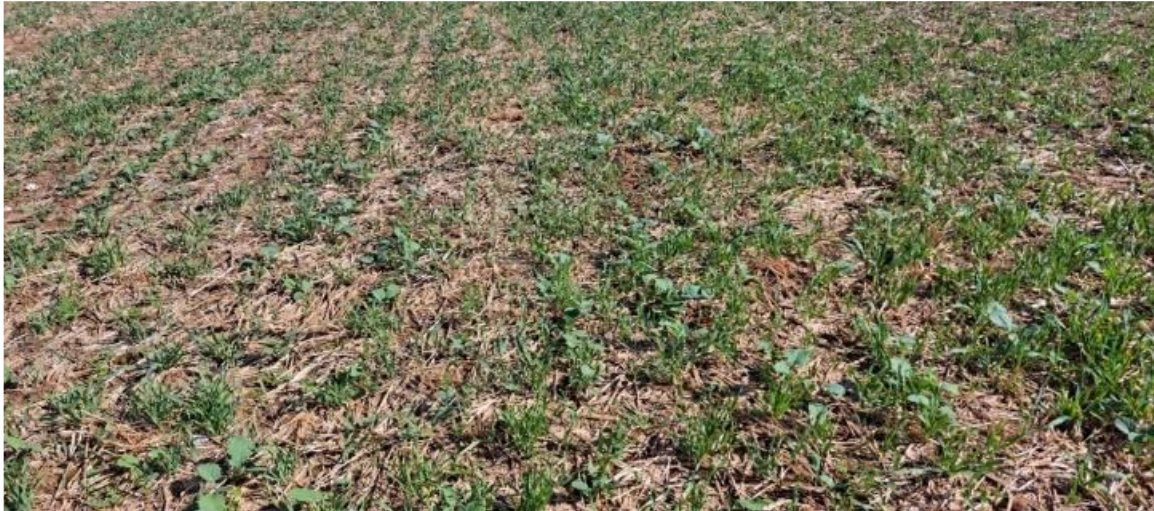
Repousses de blé dans le colza

Dans les précédents céréales à paille, les repousses sont en cours de développement. Il convient de ne pas les laisser concurrencer les jeunes colzas pour l'accès à l'eau.