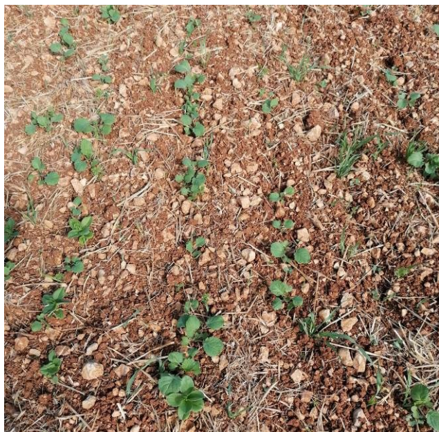
Colza associé, semis du 10/08, stade 2-3 feuilles, CL. Lévêque (CA89)

Les semis de la semaine dernière sont encore en terre, tandis que pour les parcelles levées, les stades s'échelonnent entre cotylédons et 4 feuilles vraies.