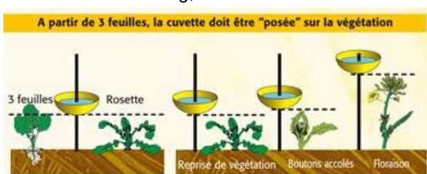
Cuvette en végétation (illustration Terres Inovia)

On enterre la cuvette dans le sol pour favoriser les captures à l'occasion de ses sauts (piège d'interception). Les altises doivent pouvoir tomber dans le piège au fil de leur avancée dans la parcelle.