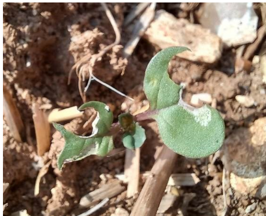
Dégâts de limace, E. Joudelat (CA89)