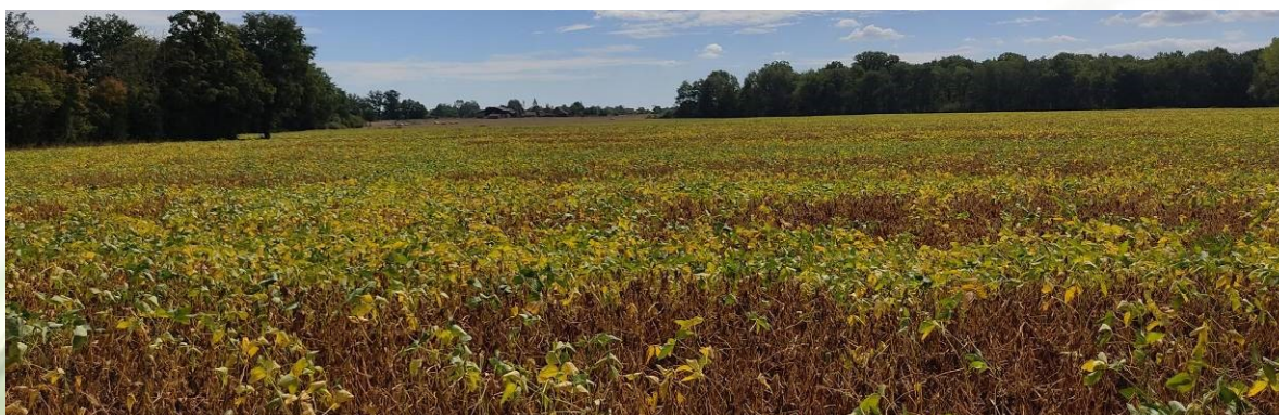
Soja : stades hétérogènes, M. Gipouloux (Terres Inovia)

Les stades sont très hétérogènes d'une parcelle à l'autre, et à l'intérieur même des parcelles (profondeur de sol, date de semis, variété).