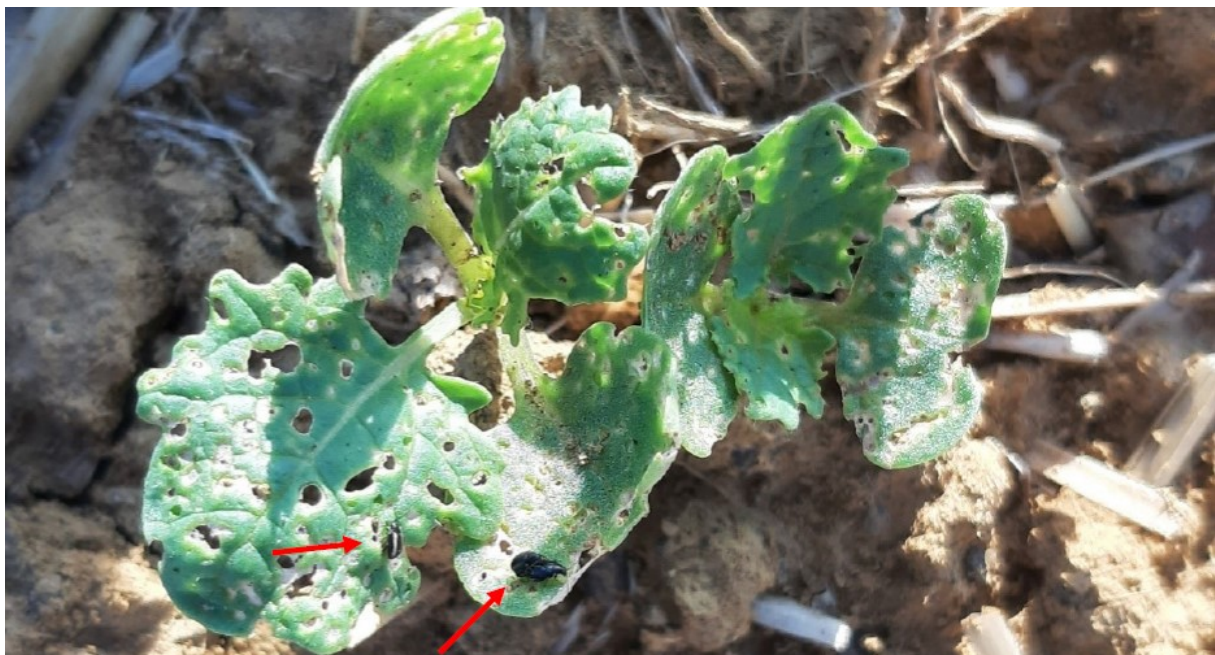
Petites altises et dégâts : risque moyen pour cette parcelle. E. Courbet (CA70)

Les grosses altises sont observées dans 2 situations : SIMARD (71) et CHARBUY (89), avec un seul insecte à chaque fois.