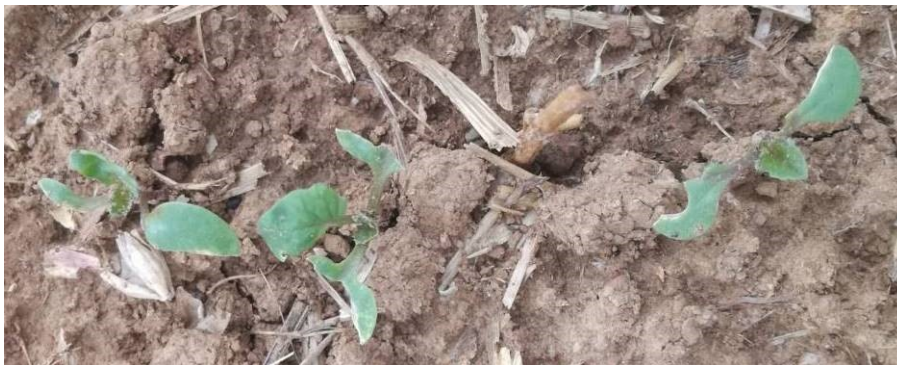
Dégâts d'oiseaux, E. Joudelat (CA89)

Il convient de ne pas les confondre avec des limaces (feuilles déchiquetées, absence de bave).