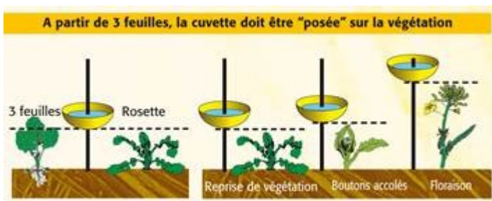
Cuvette en végétation (illustration Terres Inovia)

On enterre la cuvette dans le sol pour favoriser les captures à l'occasion de ses sauts (piège d'interception). Les altises doivent pouvoir tomber dans le piège au fil de leur avancée dans la parcelle.