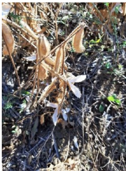
Eclatement de gousses, E. Courbet (CA70)

La sécheresse fait griller les plantes et éclater les gousses tandis qu'il reste des graines vertes à l'intérieur.