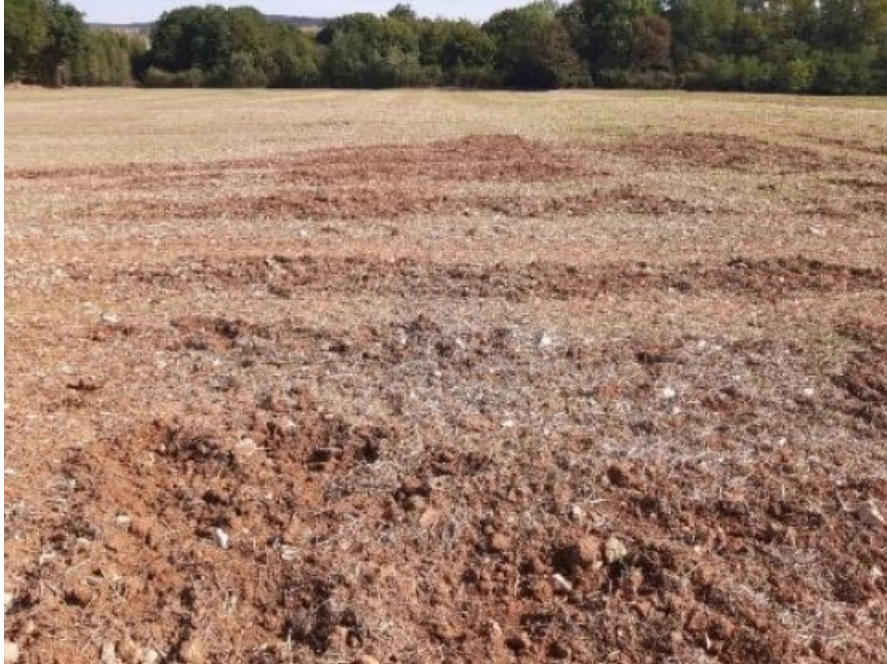
Dégâts de sanglier, E. Courbet (CA70)

Des dégâts de gibiers sont aussi localement signalés :