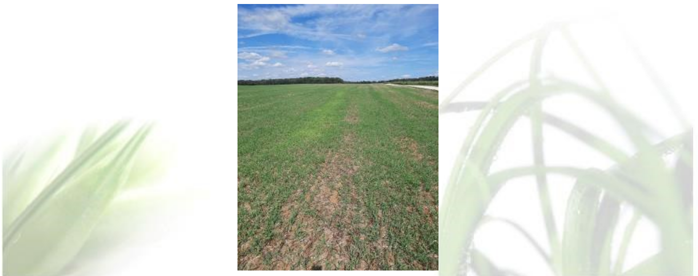
Colza au stade 2 feuilles noyé dans repousses d'OH à Sermange

Les ray-grass / vulpins sont aussi observées, de même que des levées de chénopodes et amarantes.