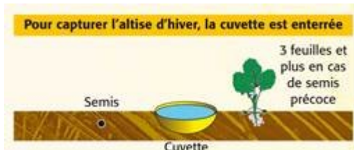
Cuvette enterrée (illustration Terres Inovia)

Elles se placent au niveau de la végétation sauf pour les grosses altises (altises d'hiver) ou la cuvette doit être enterrée.