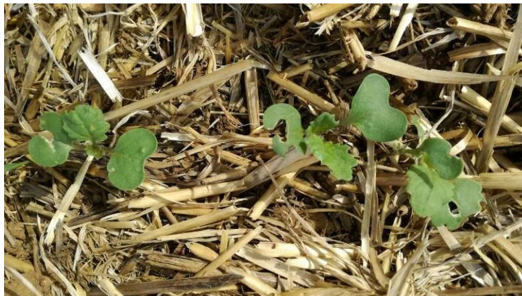
Dégâts de limaces, E. Joudelat (CA89)

Hors réseau, des limaces grises sont signalés dans des parcelles en Agriculture de Conservation des Sols.