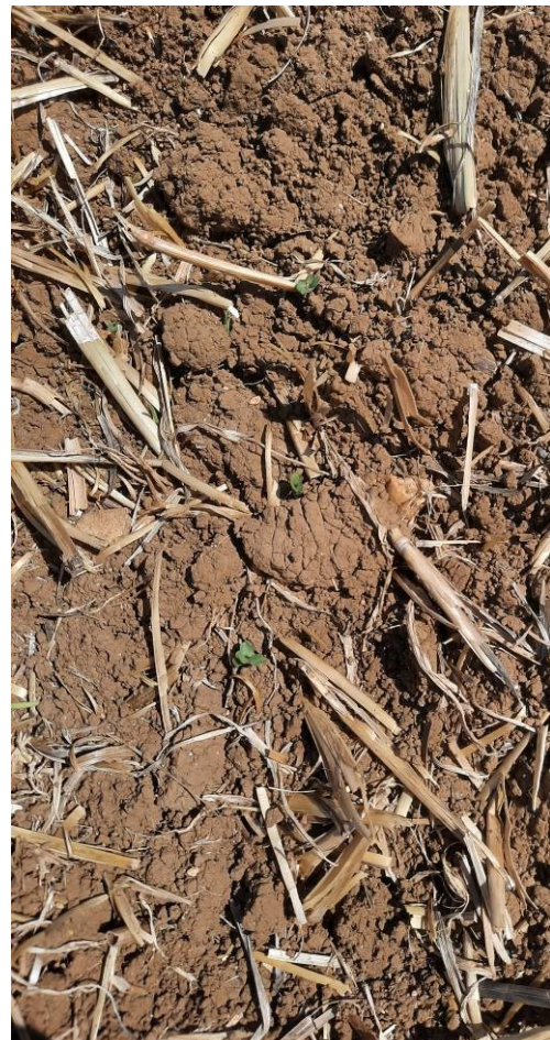
Levées plus ou moins homogènes (une dizaine de mm depuis le semis), S. Joud (CA39)