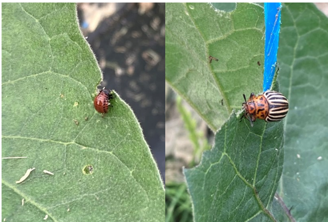
Des larves et adultes déjà présents dans les parcelles du réseau. Pougny (58) 22/05/2023