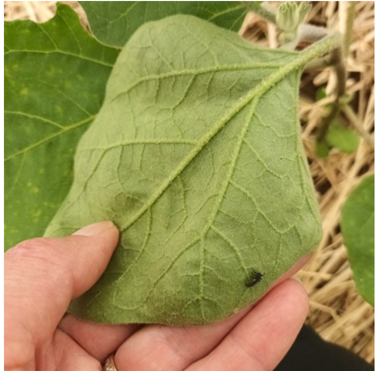
Outre les pucerons momifiés, les larves de coccinelles font aussi leur apparition 22/05/2023, Fenay, (21)