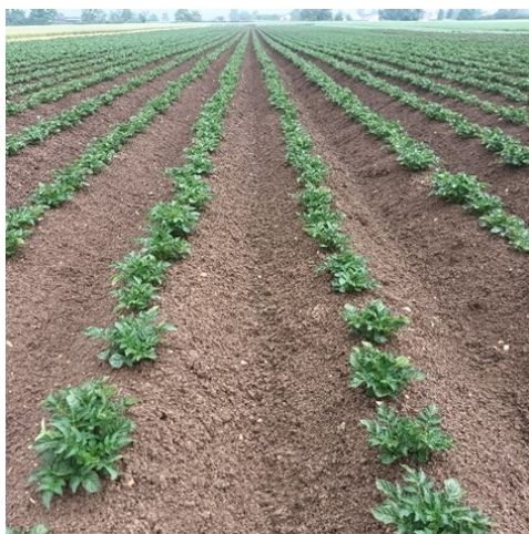
Noiron-sous-Gevrey (21), 22/05/2022

Seule 1 parcelle n'est pas levée, pour les plus précoces les rangs se ferment.