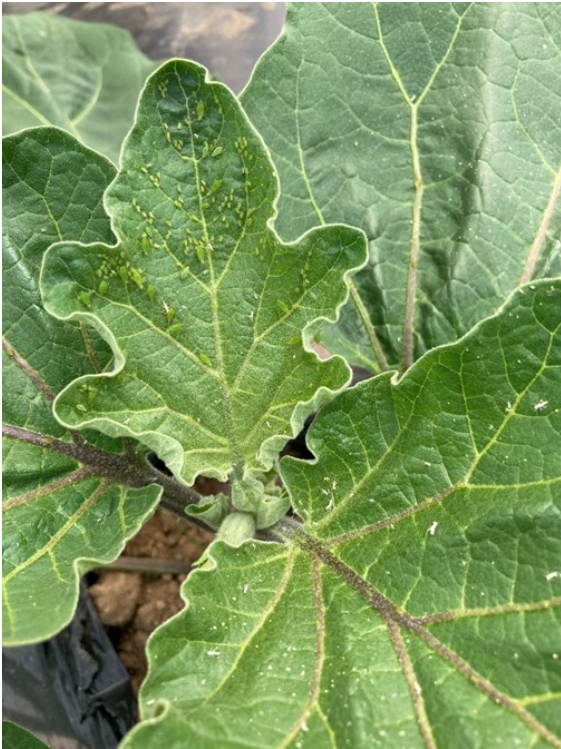
Colonies de pucerons 22/05/2023, Beffes (18)