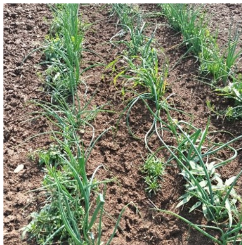
Oignons repiqués, Fenay (21), 22/05/2023

Suite aux pluies reçues par certaines parcelles, les adventices se sont très rapidement développées et le désherbage est difficile, en particulier sur le rang.