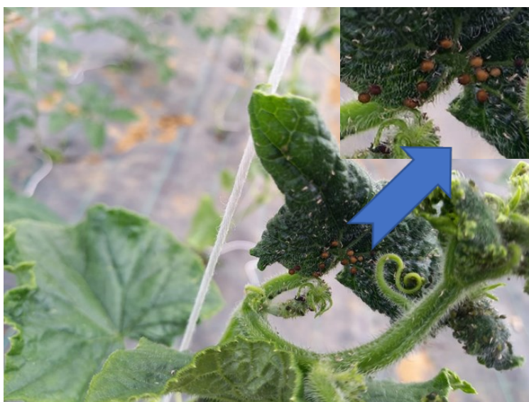
Colonies de pucerons avec présence de momies 22/05/2023, Grosbois, (25)

Les auxiliaires naturellement présents peuvent permettre de contenir les populations. On note la présence de momies et de micro-hyménoptères.