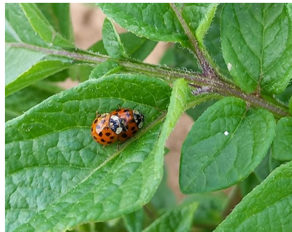
Coccinelles, La Barre (25), 22/05/2023

Quelques adultes ailés sont observés dans 5 parcelles. Des coccinelles et quelques chrysopes sont observées sur 7 parcelles. Leur présence est suffisante pour réguler les populations de pucerons qui pourraient s'installer.