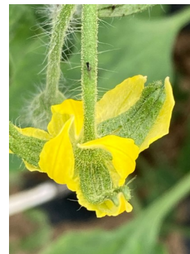
Quelques pucerons ailés observés pour le moment. Surgy (58), 23/05/2023

Il est important de surveiller l'évolution des populations de pucerons et de bien les contenir pour éviter les développements exponentiels, en particulier en agriculture biologique. Si les auxiliaires naturels sont peu présents, des lâchers d'auxiliaires peuvent être réalisés.