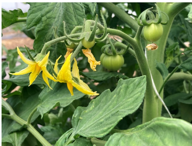
Premiers fruits observés depuis plusieurs jours 22/05/2023, Beffes (18)

Les stades vont de 6 feuilles à 1ères fleurs ouvertes.