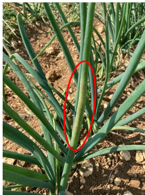
Tache caractéristique et duvet de Peronospora destructor , Pougny (58), 22/05/2023

Le risque est moyen mais peut devenir élevé selon la pluviométrie reçue par les parcelles et les prévisions météo pour les jours prochains.