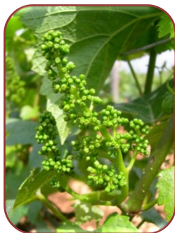
Boutons floraux séparés

La remontée progressive des températures, dans ce contexte de sols très humides, stimule le développement de la vigne.