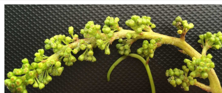
Mildiou sur inflorescence (rot gris)

Une surveillance régulière des parcelles et de leur environnement s'impose pour suivre l'évolution de la situation.