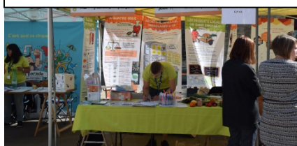
Après-midi conte à la médiathèque de Viry –Haut Jura 17/09/2016