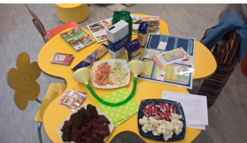
Animation médiathèque Viry – Haut Jura 17/09/2016