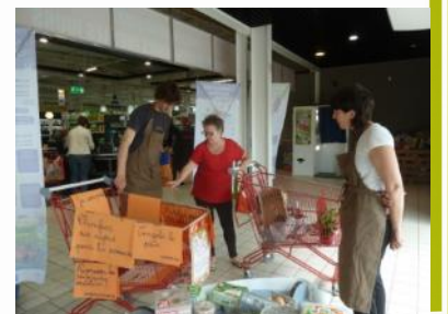
Intervention supermarché – Vallée de l'Ognon