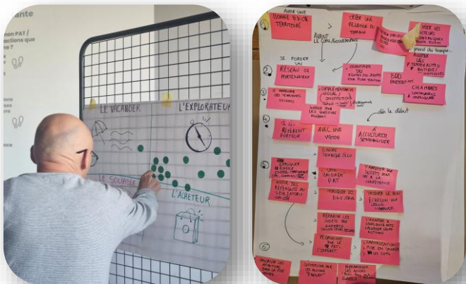
Journées d'Échanges de Pratiques 2024